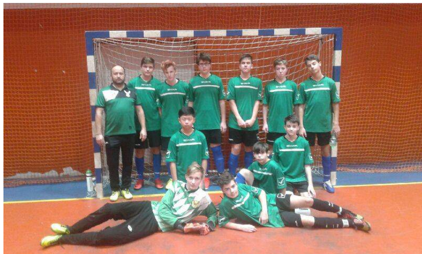
Foto starších žáků TJ Dobšice/Suchohrdly

Závěrem bych chtěl poděkovat všem trenérům a organizátorům tohoto soustředění, zejména TJ Sokolu Dobšice za vzornou organizační stránku.